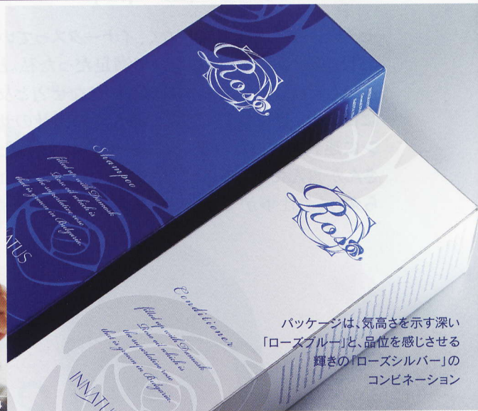
パッケージは、気高さを示す深い「ローズブルー」と、品位を感じさせる輝きの「ローズシルバー」のコンビネーション